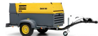
GAMA QAX (QAX 24 - QAX 70) Desde 19 hasta 54 KW (60 Hz)