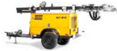
QLT M10 Motor diésel, mástil mecánico 4 lámparas de 1000 w cada una.