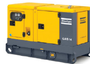
GAMA QAS FLX (QAS 15 - QAS 220) Desde 13 hasta 176 KW (60 Hz)