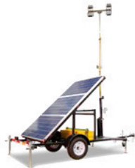
QLTS, 4-6-8 LED, panel solar, mástil mecánico 4 lámparas.