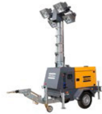
QLT H50 Motor diésel, mástil hidráulico 4 lámparas de 1000 w cada una.