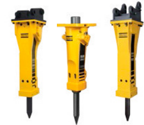
MARTILLOS HIDRÁULICOS Peso en servicio 55 - 10,000 kg Para máquinas portadoras de 0,7-140 toneladas.

Aplicaciones: Demolición, rotura primaria y secundaria, desbastado, excavación de zanjas, excavación de rocas, trabajos de cimentación.