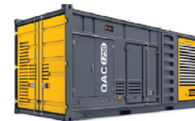
GAMA QAC (QAC 800 - QAC 1250) Desde 770 hasta 1250 KW (60 Hz)