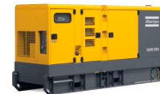
GAMA QAS (QAS 125 - QAS 500) Desde 105 hasta 457 KW (60 Hz)